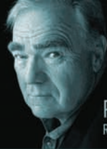
Роберт Макки Robert McKee

Его книга «История на миллион долларов» стала главным пособием по сценарному мастерству во всём мире.