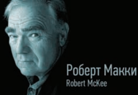
Роберт Макки Robert McKee

Среди его студентов — 35 обладателей премии «Оскар», 164 обладателя премии «Эмми», 29 обладателей премии WGA («Гильдия писателей Америки»), 25 обладателей премии DGA («Гильдия режиссеров Америки»)