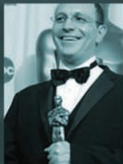
Акива Голдсман сценарист («Игры разума», «Код да Винчи» и др).

«Я прослушал курс Макки. Он был полон пронциательных наблюдений. Я верю ему»