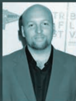
Зак Пенн сценарист («Люди Икс», «Мстители», «Великолепный Халк» и др).

«Мой совет прост. Приходите на мастер-класс Макки. Это стало важнейшей причиной моего успеха как сценариста»