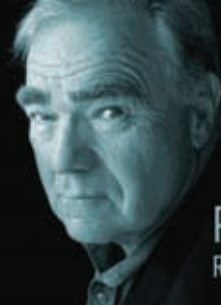
Роберт Макки Robert McKee

Роберт Макки консультирует ведущие кино- и телекомпании. Такие студии и телеканалы как ABC, Disney, Miramax, PBS, Nickelodeon, Paramount и Pixar, постоянно направляют своих сотрудников на его лекции.