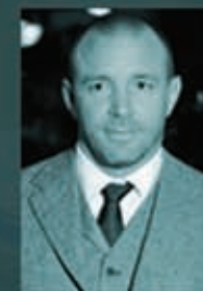
Гай Ричи режиссёр

«Малышка на миллион», «Квант милосердия»