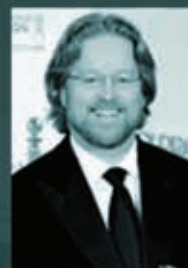
Эндрю Стентон сценарист

«Игры разума», «Бэтмэн и Робин», «Нондаун», «Код да Винчи»