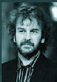
Питер Джексон сценарист, режиссёр, продюсер

«Властелин колец», «Небесные создания», «Милые ности»