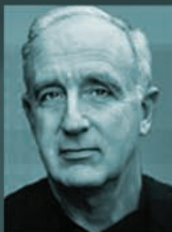
Стивен Прессфилд писатель, сценарист («Кинг Конг жив», «Врата огня»)

«Мой совет прост. Приходите на мастер-класс Макки. Это стало важнейшей причиной моего успеха как сценариста»