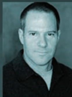
Тоби Эммерих продюсер («Эффект бабочки», «Секс в большом городе», «Перемотка», «Незванные гости»). Первый сценарий Тоби «Frequency» оптирован за $500,000.

«Я более чем когда-либо убежден, что сценарий — это только история. Макки — неутомимый оратор, знающий и страстный. Хотел бы я послушать его ДО того, как начал писать свой первый сценарий, чтобы заработать на жизнь»