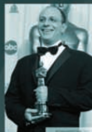
Акива Голдсман сценарист

«Быть Джоном Малковичем», «Вечное сияние чистого разума»