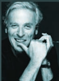
Уильям Голдман обладатель двух Оскаров, сценарист («Вся президентская рать», «Буч Кэссиди и Санденс Кид», «Принцесса-невеста» и др).

«Я прослушал курс Макки. Он был полон пронциательных наблюдений. Я верю ему»