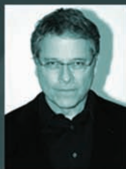
Лоуренс Каздан сценарист, режиссёр, трижды номинант на премию киноакадемии («Звёздные войны», «Империя наносит ответный удар», «Возвращение Джедая», «Большой каньон»)

«Знание структуры истории так же жизненно необходимо для писателя, как и для сценариста. Никто не воплощает эту мудрость лучше Роберта Макки. Он не только лучший учитель сценарного мастерства, он лучший учитель всего на свете»