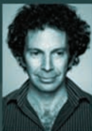
Чарли Кауфман сценарист

«Властелин колец», «Небесные создания», «Милые ности»