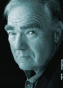
Роберт Макки Robert McKee