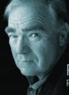
Роберт Макки Robert McKee

«Курс Роберта Макки заслужил поистине всемирное признание не только как отличное место для начала творческой карьеры, но и как источник, к которому уже опытные авторы возвращаются снова и снова».