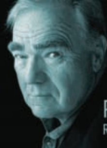
Роберт Макки Robert McKee