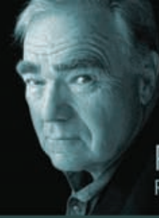
Роберт Макки Robert McKee

Бизнес-консультациями Макки регулярно пользуются: