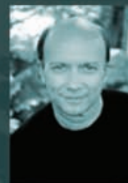
Пол Хаггис сценарист

«Малышка на миллион», «Квант милосердия»