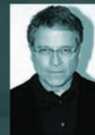
Лоуренс Касдан сценарист, режиссёр

«Унесённые», «Шерлок Холмс», «Карты, деньги и два ствола»